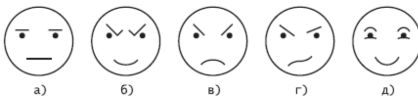
Рис. Выражение лица и эмоциональное состояние

Ответы: 1 – г); 2 – в); 3 – д); 4 – б); 5 – а).